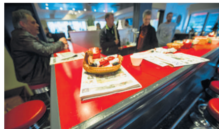
L'Espace est ouvert de 9 h à 17 h du lundi au samedi. YANNICK BAILLY

La structure destinée plus spécifiquement aux toxicomanes a aussi ouvert ses portes, hier. Le lieu, provisoirement installé dans les locaux de la Soupe populaire, tolère la consommation d'alcool, contrairement à l'Espace. Mais hier, en milieu après-midi, seule une personne sirotait sa bière. Mais comme le relève un assistant social: «Cela commence toujours doucement.» R.B.